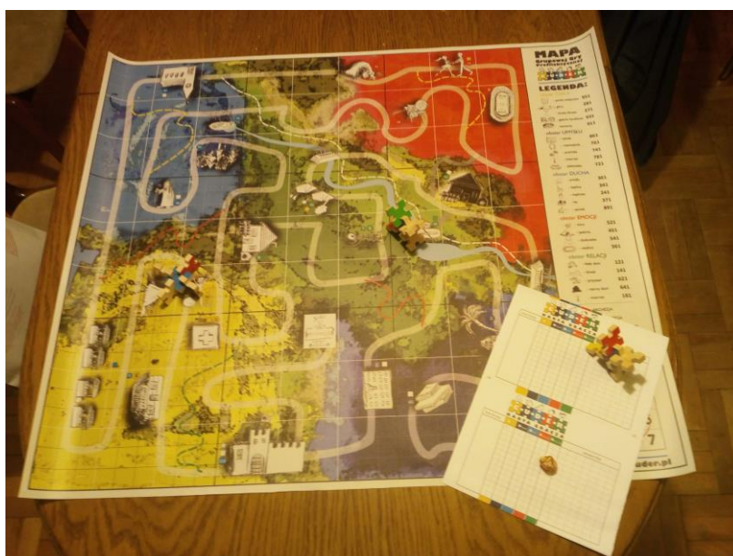
Wersja miniaturowa planszy z gry CUDER dla dzieci

Gra stanowi element warsztatowy, rozwijający i wzbogacający poprzednie części programu. Poza tym uczestnicy mogą w działaniu sprawdzić swoją wiedzę o rozwoju człowieka oraz wzmocnić umiejętności dotyczące podejmowania decyzji i współpracy w grupie. O posunięciach jednego pionka bowiem może decydować pięć wybranych osób i każda odpowiada za konkretną sferę CUDERA.