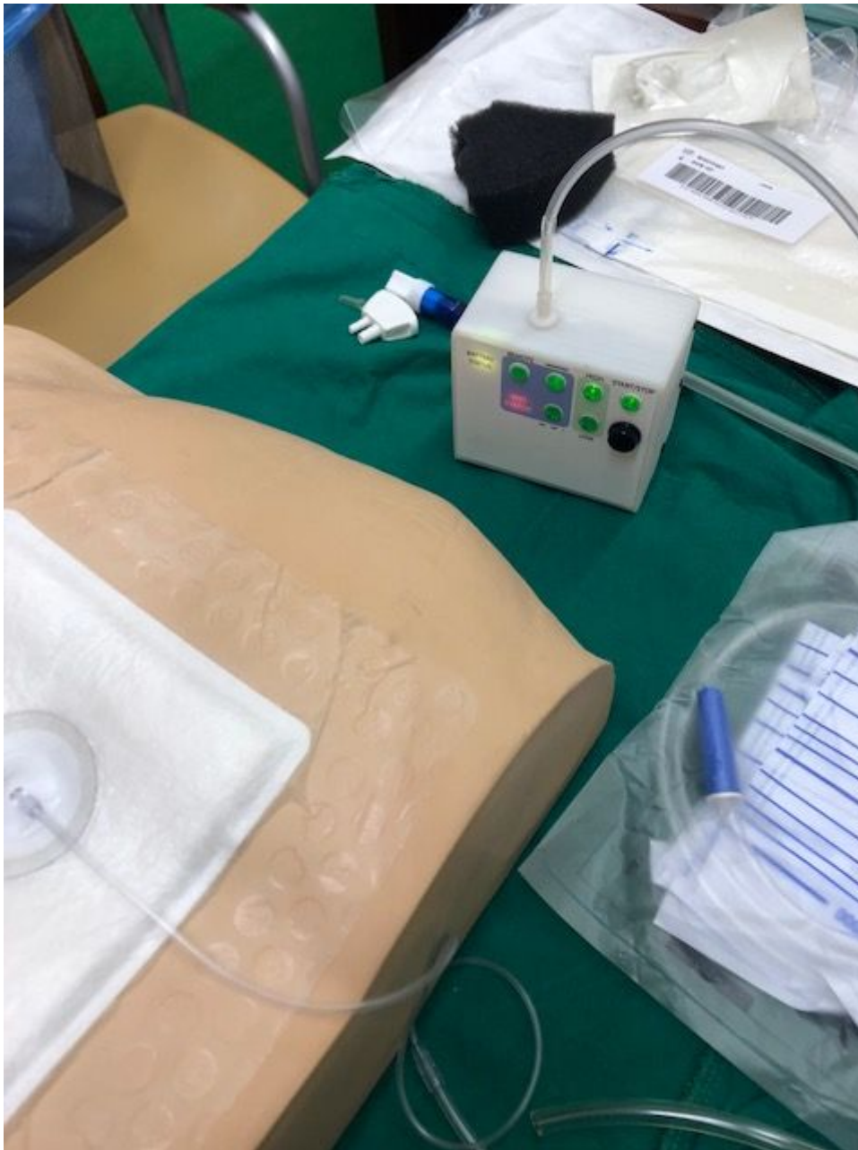
Opatrunek z materiałem chłonnym wysięki.