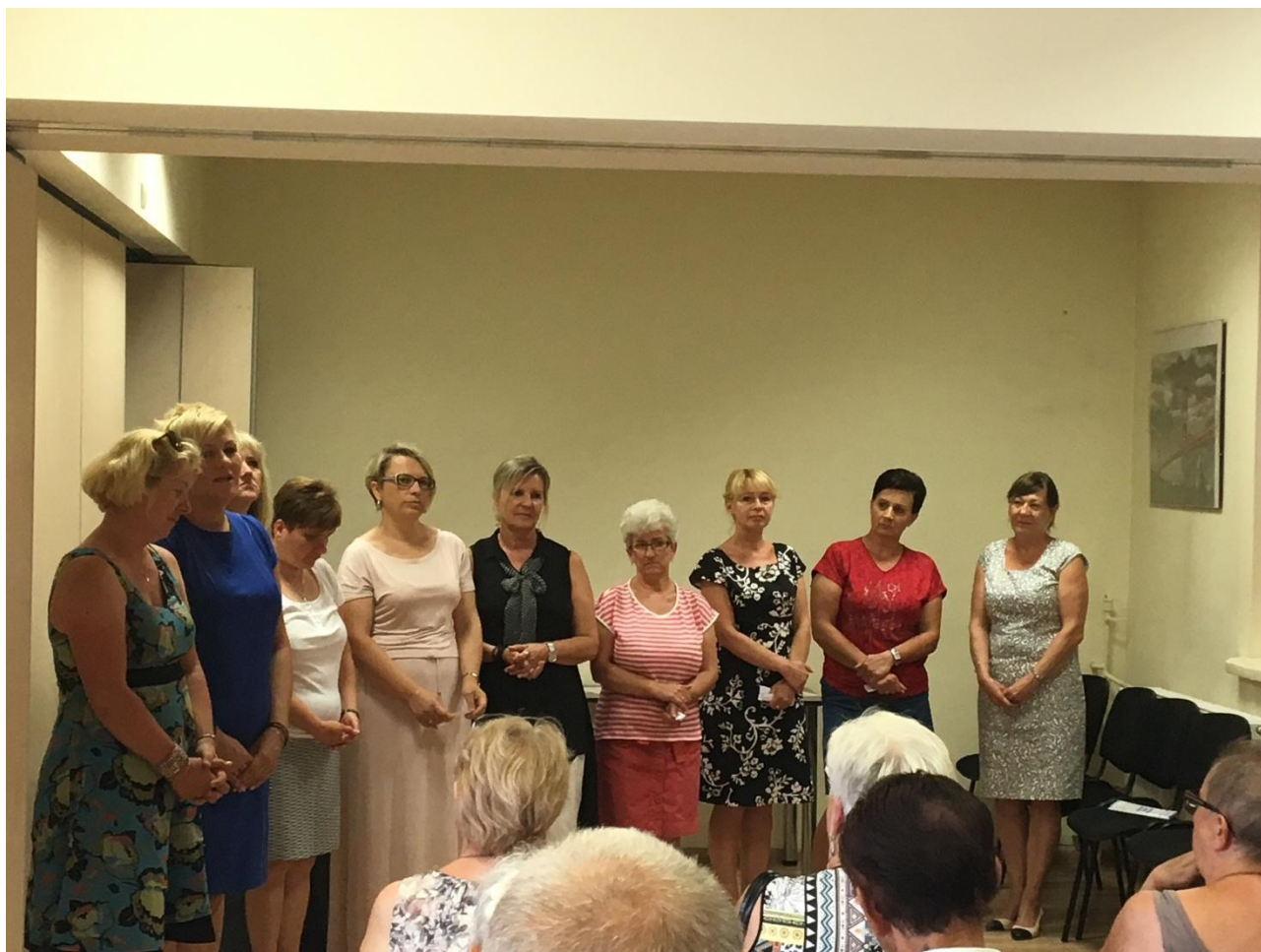
Event na zakończenie innowacji społecznej

W ramach projektu "Chcemy pracować - innowacje w zakresie usług opiekuńczych dla osób zależnych (nr umowy: POWR.04.01.00-00-1062/15), w ramach programu Operacyjnego Wiedza Edukacja Rozwój 2014-2020 współfinansowanego ze środków Europejskiego Funduszu Społecznego, zawartej w dniu 12.07.2016 roku