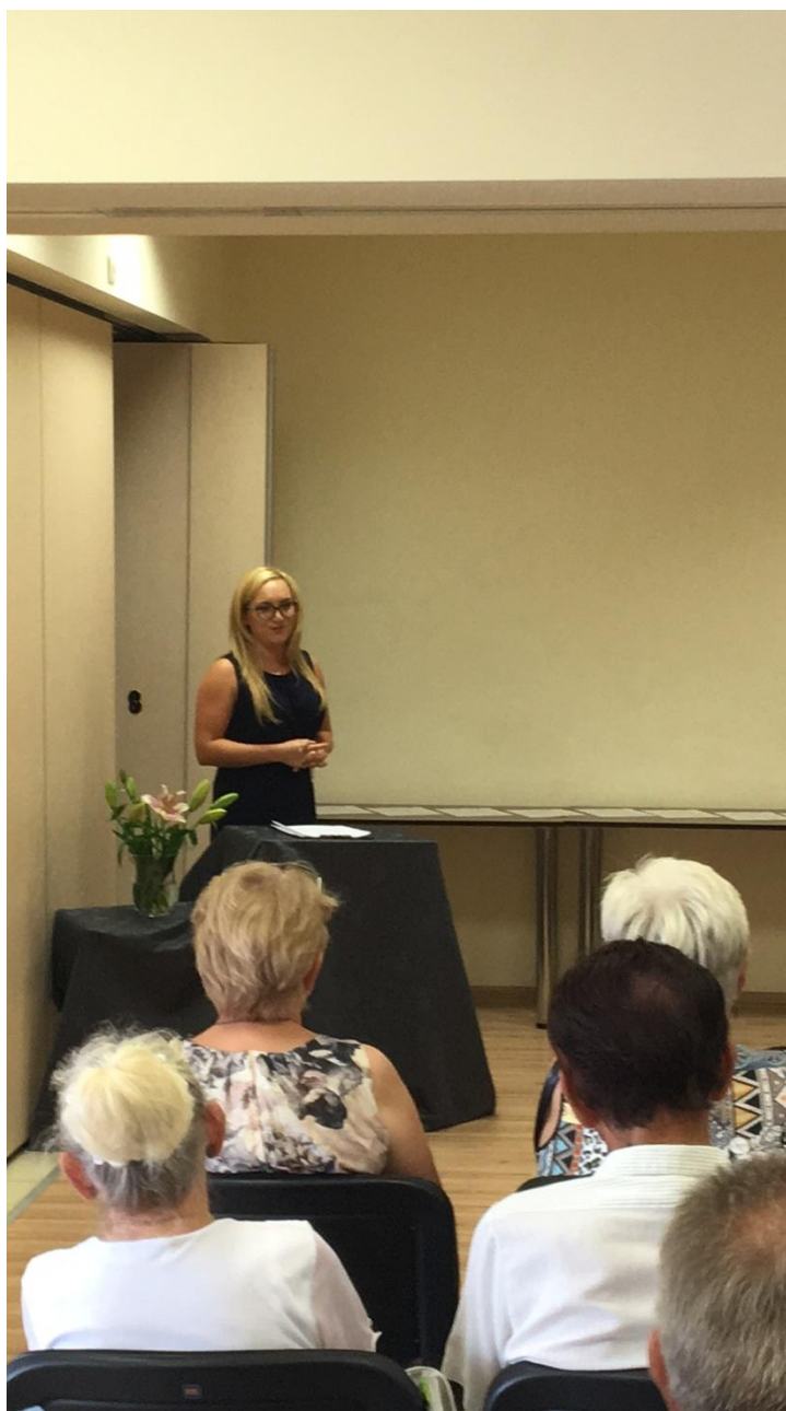
Event na zakończenie innowacji społecznej

W ramach projektu "Chcemy pracować - innowacje w zakresie usług opiekuńczych dla osób zależnych" (nr umowy: POWR.04.01.00-00-1062/15), w ramach programu Operacyjnego Wiedza Edukacja Rozwój 2014-2020 współfinansowanego ze środków Europejskiego Funduszu Społecznego, zawartej w dniu 12.07.2016 roku