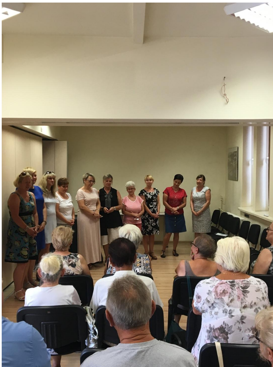
Event na zakończenie innowacji społecznej

W ramach projektu "Chcemy pracować - innowacje w zakresie usług opiekuńczych dla osób zależnych" (nr umowy: POWR.04.01.00-00-1062/15), w ramach programu Operacyjnego Wiedza Edukacja Rozwój 2014-2020 współfinansowanego ze środków Europejskiego Funduszu Społecznego, zawartej w dniu 12.07.2016 roku