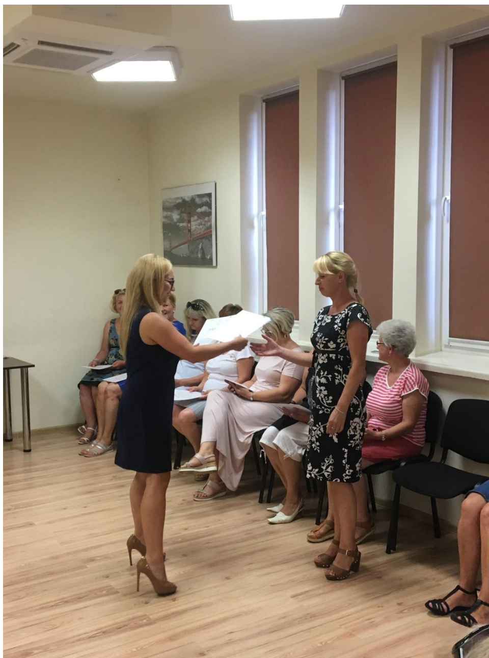
Event na zakończenie innowacji społecznej

W ramach projektu "Chcemy pracować - innowacje w zakresie usług opiekuńczych dla osób zależnych" (nr umowy: POWR.04.01.00-00-1062/15), w ramach programu Operacyjnego Wiedza Edukacja Rozwój 2014-2020 współfinansowanego ze środków Europejskiego Funduszu Społecznego, zawartej w dniu 12.07.2016 roku