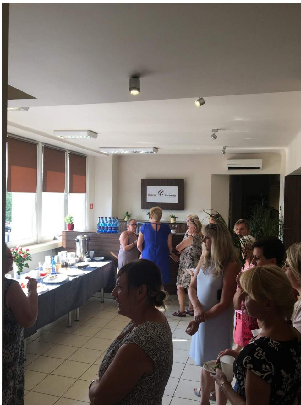
Event na zakończenie innowacji społecznej

W ramach projektu "Chcemy pracować - innowacje w zakresie usług opiekuńczych dla osób zależnych (nr umowy: POWR.04.01.00-00-1062/15), w ramach programu Operacyjnego Wiedza Edukacja Rozwój 2014-2020 współfinansowanego ze środków Europejskiego Funduszu Społecznego, zawartej w dniu 12.07.2016 roku