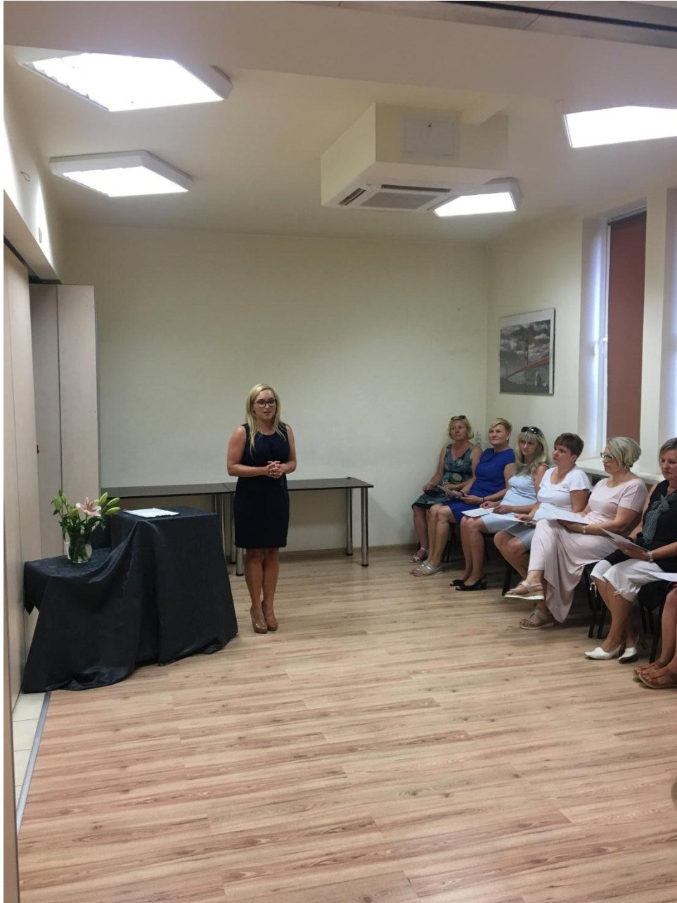
Event na zakończenie innowacji społecznej

W ramach projektu "Chcemy pracować - innowacje w zakresie usług opiekuńczych dla osób zależnych (nr umowy: POWR.04.01.00-00-1062/15), w ramach programu Operacyjnego Wiedza Edukacja Rozwój 2014-2020 współfinansowanego ze środków Europejskiego Funduszu Społecznego, zawartej w dniu 12.07.2016 roku