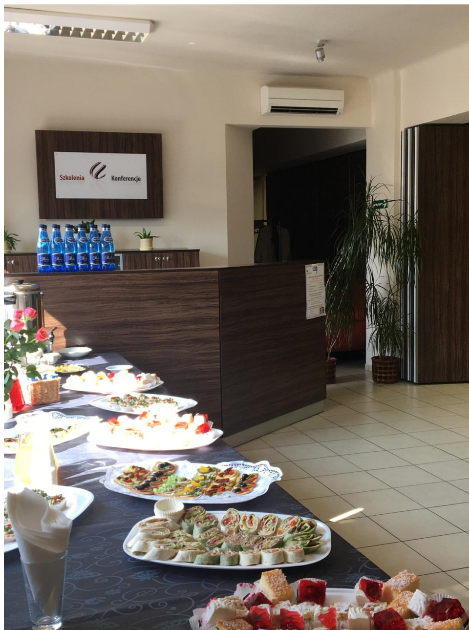
Event na zakończenie innowacji społecznej

W ramach projektu "Chcemy pracować - innowacje w zakresie usług opiekuńczych dla osób zależnych (nr umowy: POWR.04.01.00-00-1062/15), w ramach programu Operacyjnego Wiedza Edukacja Rozwój 2014-2020 współfinansowanego ze środków Europejskiego Funduszu Społecznego, zawartej w dniu 12.07.2016 roku