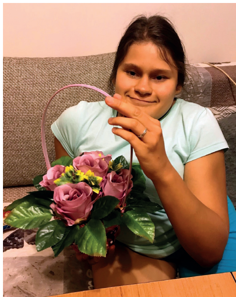
Zajęcia indywidualne z florystką wykonane prace