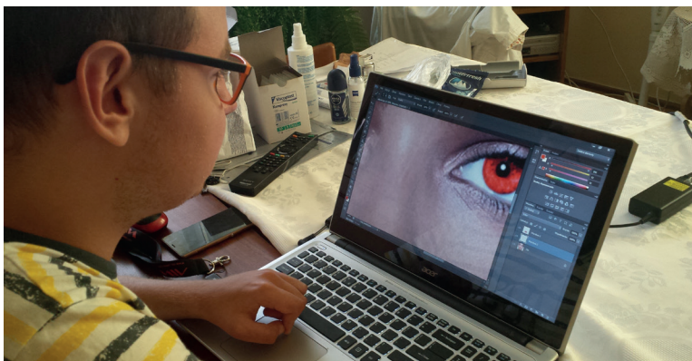
Zajęcia indywidualne w domu niepełnosprawnego – obsługa komputera i grafika komputerowa