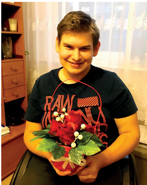
Zajęcia indywidualne z florystką wykonane prace