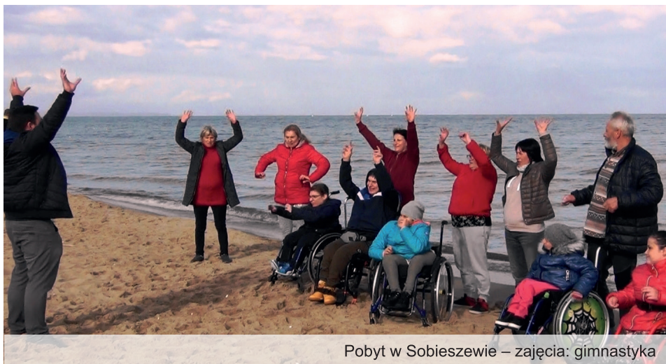
Pobyty w Sobieszewie – zajęcia: gimnastyka