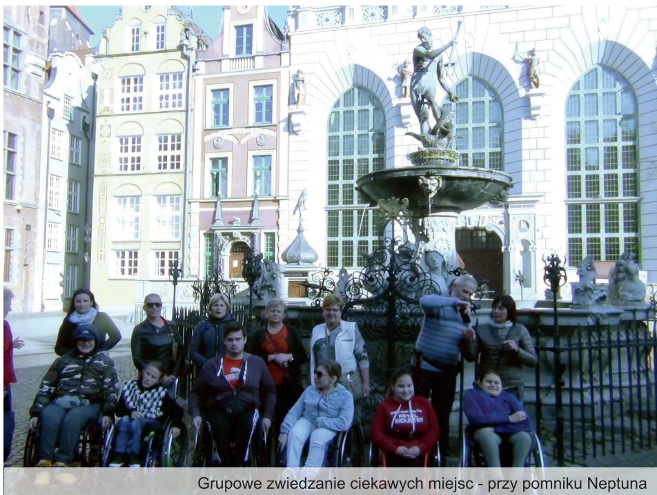
Grupowe zwiedzanie ciekawych miejsc - przy pomniku Neptuna