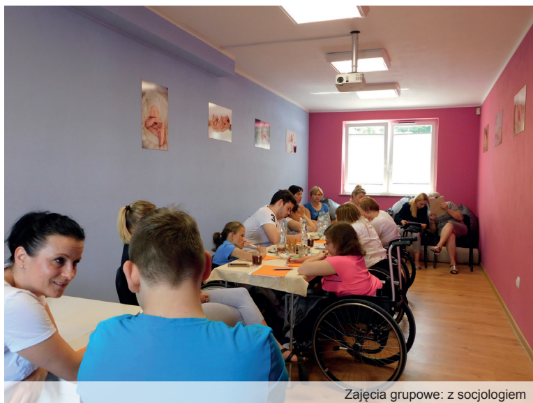
Zajęcia grupowe: z socjologiem