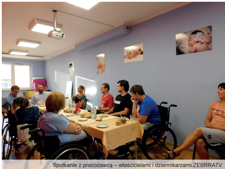
Spotkanie z pracodawcą – właścicielami i dziennikarzami ZEBRRATV