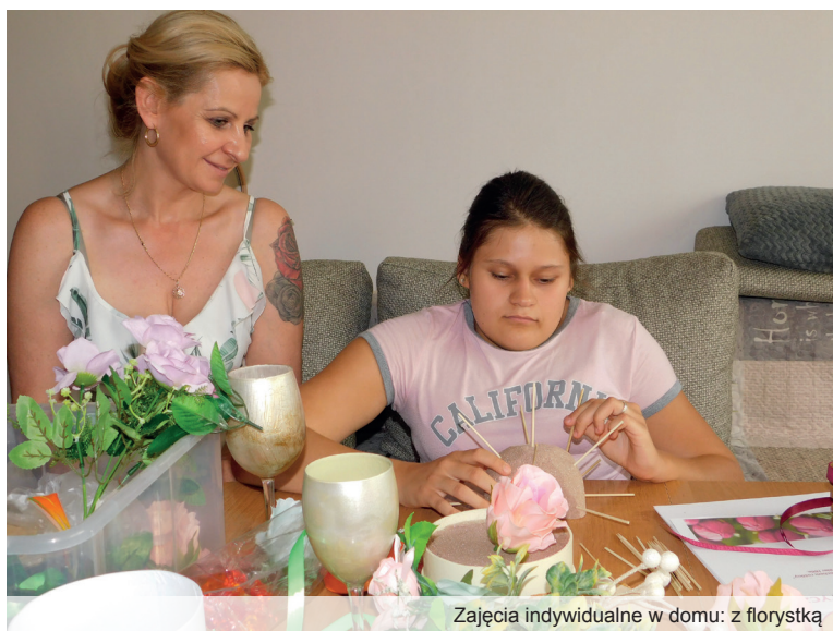
Zajęcia indywidualne w domu: z florystką