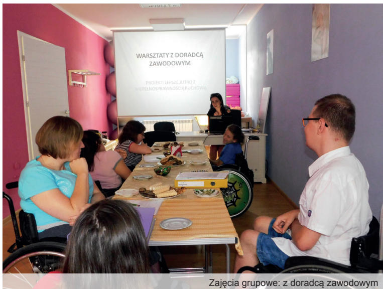
Zajęcia grupowe: z doradcą zawodowym