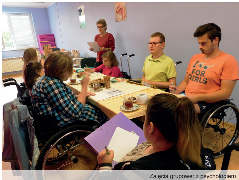
Zajęcia grupowe: z psychologiem