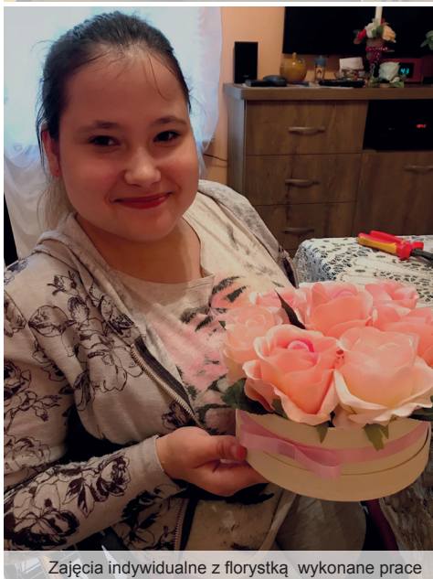
Zajęcia indywidualne z florystką wykonane prace