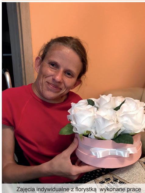
Zajęcia indywidualne z florystką wykonane prace