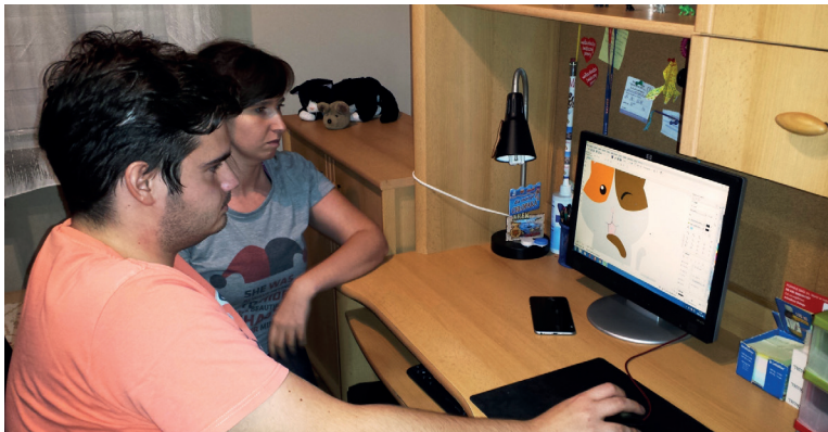
Zajęcia indywidualne w domu niepełnosprawnego – obsługa komputera i grafika komputerowa