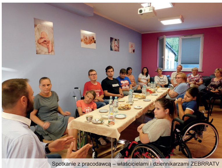
Spotkanie z pracodawcą – właścicielami i dziennikarzami ZEBRRATV