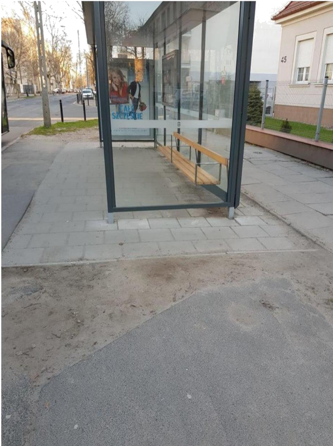
Przystanek IPN (kierunek jazdy: północ) – 1 sztuka