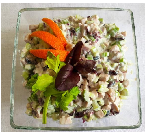
Lekkie zielone sałatki z dodatkami

Sos: jogurtu naturalny doprawiamy solą i pieprzem do smaku i zalewamy sałatkę. Sałatkę posypujemy drobno krojoną świeżą pietruszką. Dekorujemy wg pomysłu.