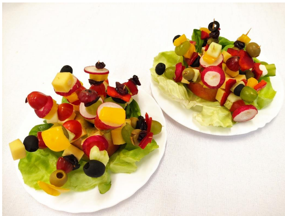
Kanapeczki na krakersach